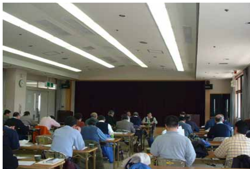
奈良市総合福祉センターで開催されたルール研修会